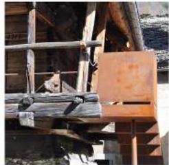
OREI "LA CITTADELLA"

ALLER AUX RUSTICOS EN POURSUIVANT UN PARCOURS PANORAMIQUE DE MOGNO A FUSIO.