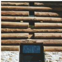
PRAU DU MULIGN