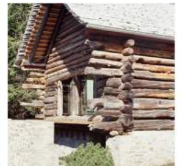
LA FORTEZZA DA MUGN