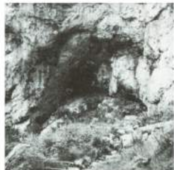
CAVA DI CALCE