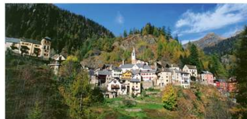
FUSIO A 2 KM DA MOGNO | LAVIZZARA.CH