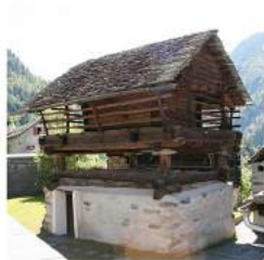
LA TORBA DA MUGN 1651