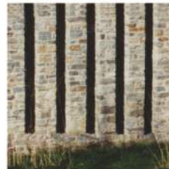
CAMPAGNA DA MUGN