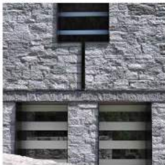
LU PIEGN DA MUGN