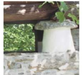
LA TORBA DI DAZI