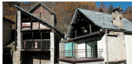
NUCLEO C'A ROCCO, AL FORN, DI VÈDUL A FUSIO