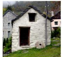
LU MULIGN DA MUGN