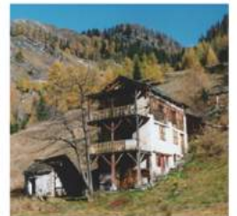
PEST CON I MULITT