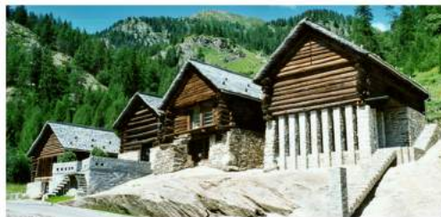
NUCLEO TECIAL A FUSIO